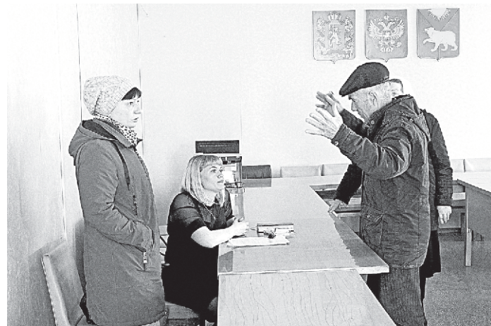
Платить за мусор люди не привыкли, и это вызывает множество возмущений

– Крупногабаритными отходами являются твердые коммунальные отходы – мебель, бытовая техника, отходы от текущего ремонта жилых помещений, размер которых не позволяет осуществить их складирование в контейнерах. Вывоз данного вида отходов будет осуществляться также по воскресеньям. Обратите внимание, что предметы мебели должны быть в разобранном состоянии и не должны иметь торчащие гвозди или болты. Крупногабаритными отходами не является строительный мусор: кирпичи, листы шифера, доски, бревна и прочее. Вывоз